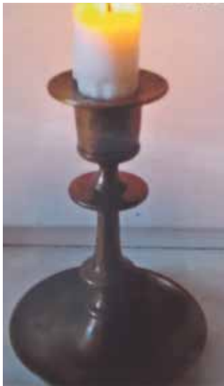
kynttilä ja tuo mieleen rakkaat muistot.

Hän kertoi, että hän olli 10-vuotiaana mennyt isänsä kanssa Pietariin hevosella viemään mattoa ja isoihin puutynnyreihin suolattuja kurkkuja. Sillä matkalla oli ostettu tämän kynttilänjalca, joka on kaikki evakkomatkat ja muutot mukana kulkenut. Aina merkityksellisinä päivinä siinä palaa